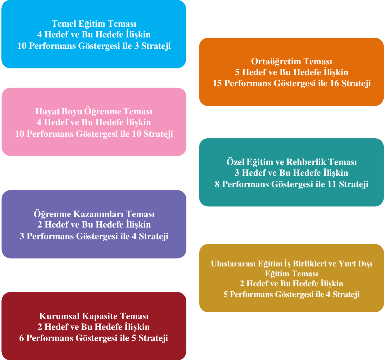
Şekil 2: Amaç, Hedef, Gösterge ve Stratejilere İlişkin Sayılar